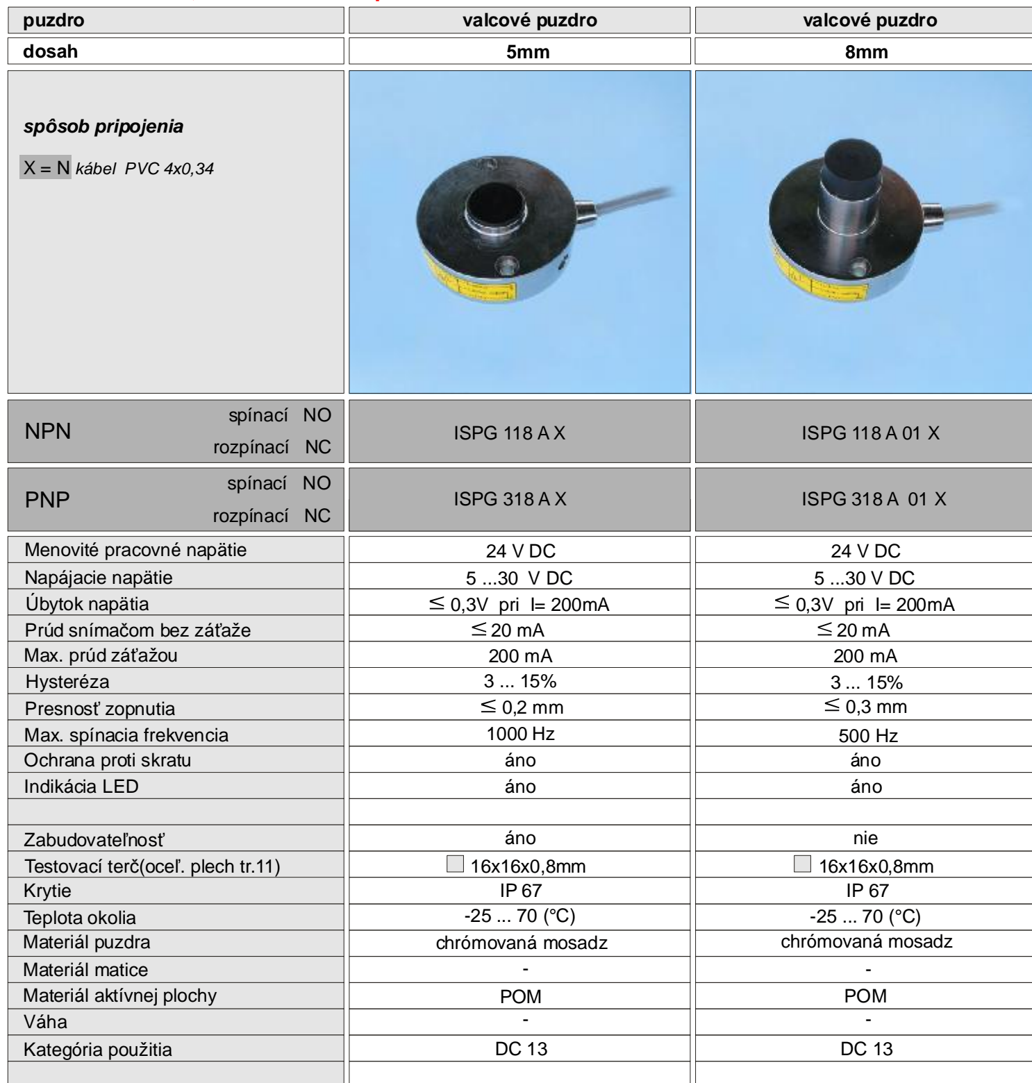
NPN - spínací a rozpínací