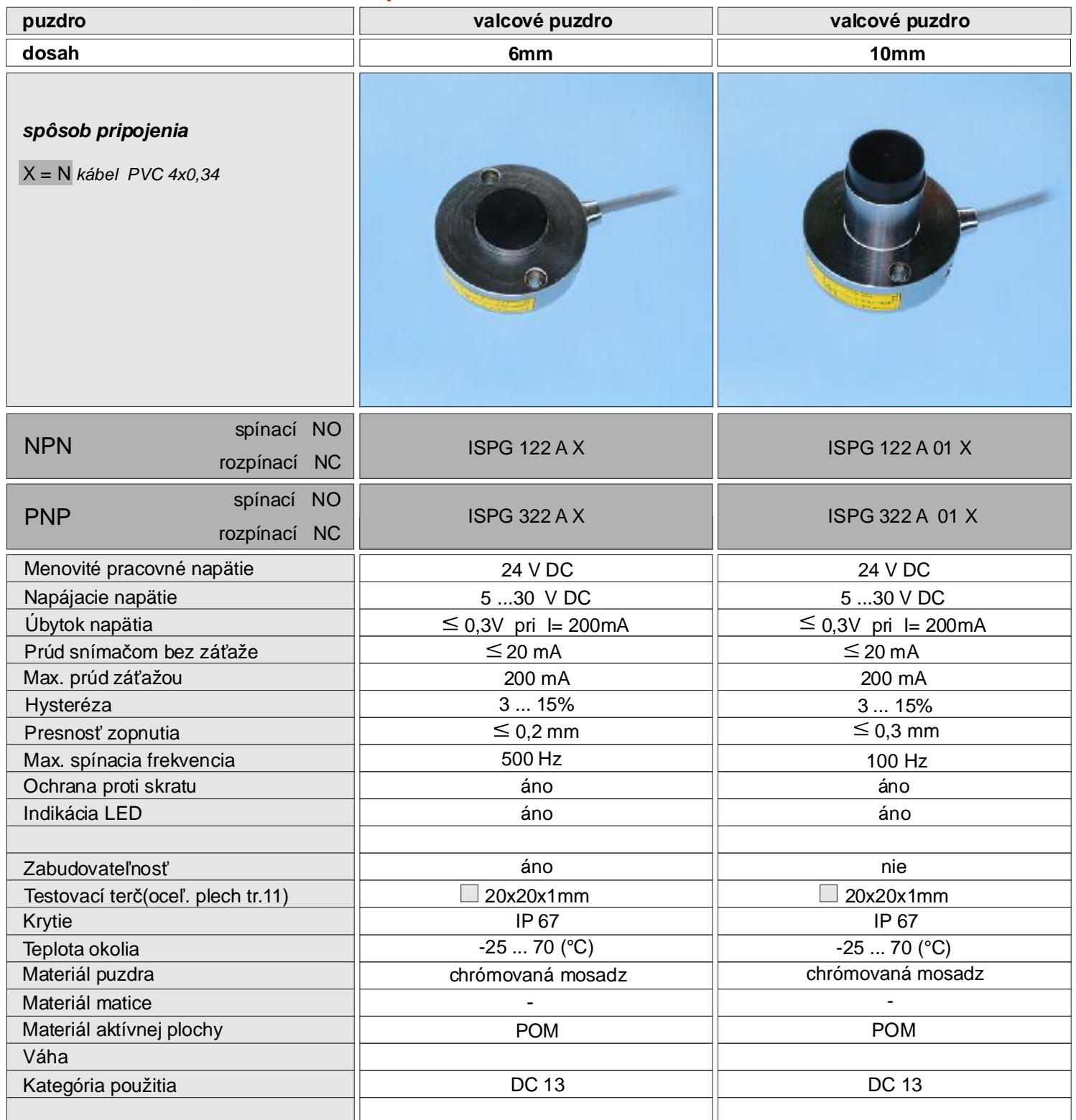
NPN - spínací a rozpínací