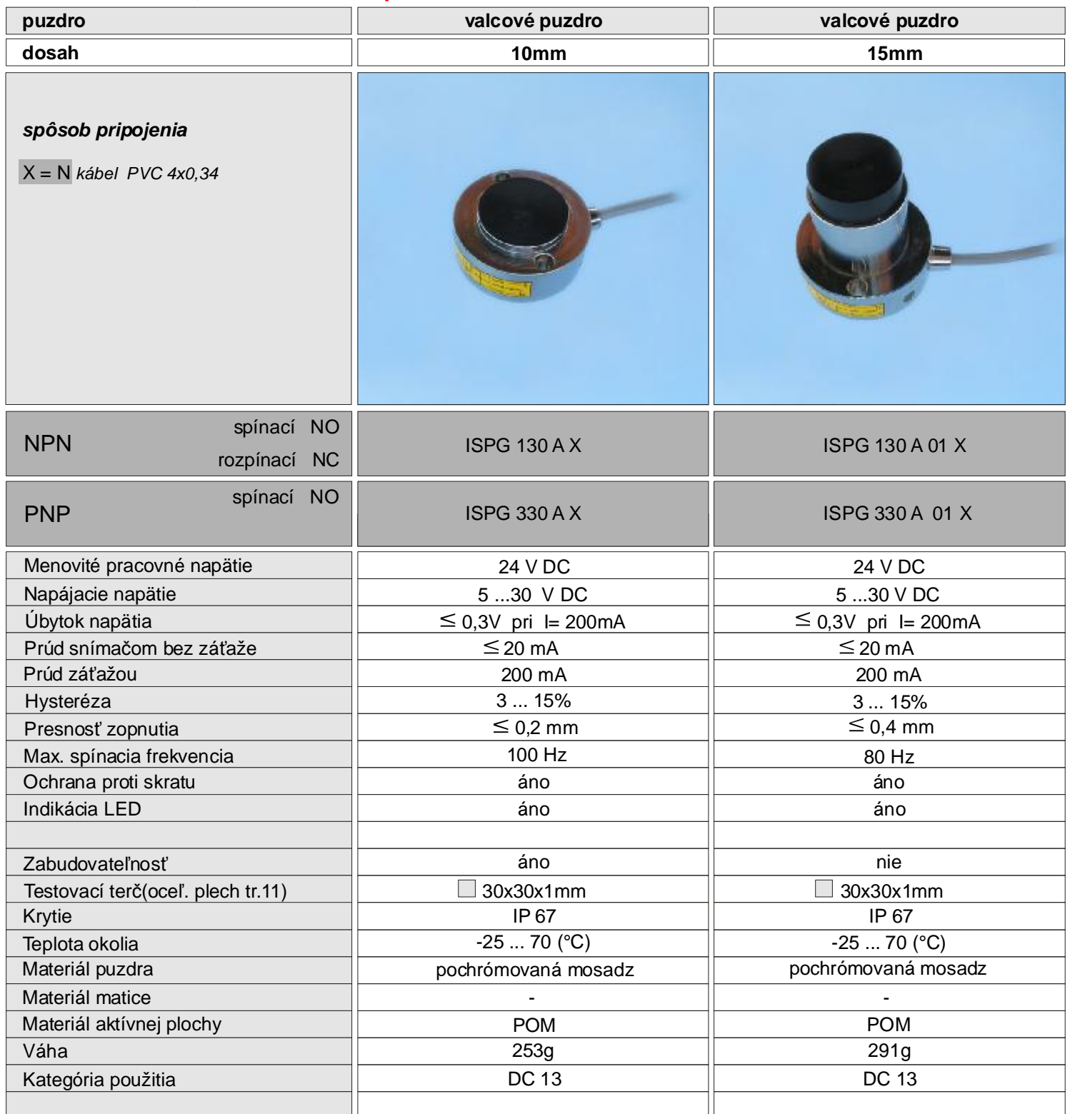
NPN - spínací a rozpínací